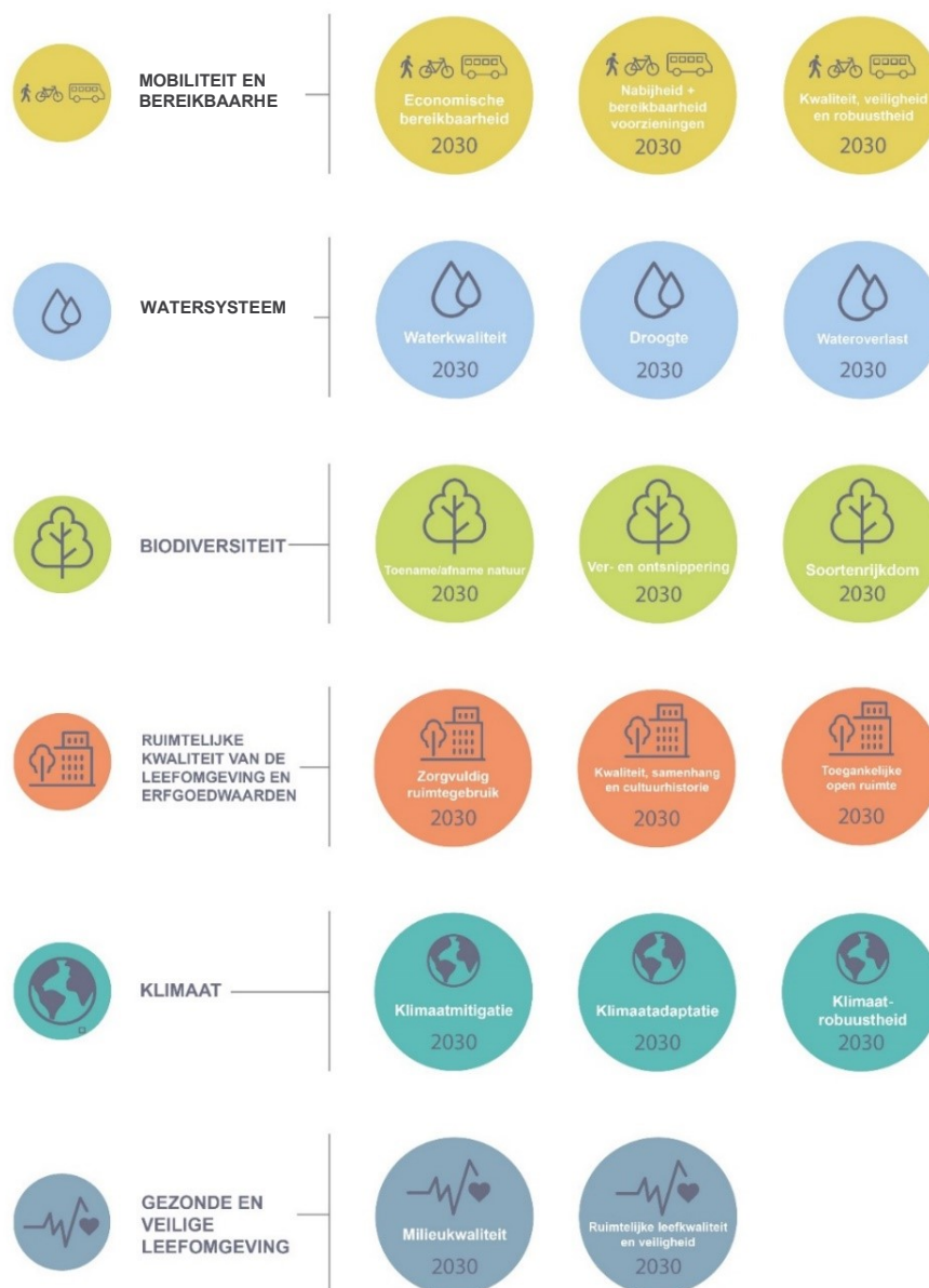
Figuur 5-1: Algemeen beoordelingskader

Volgende thema's werden voldoende relevant geacht om te onderzoeken: