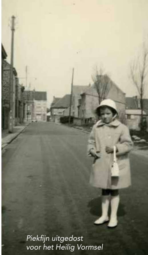
Piekfijn uitgedost voor het Heilig Vormsel