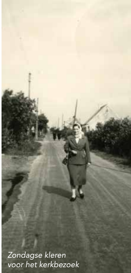
Zondagse kleren voor het kerkbezoek