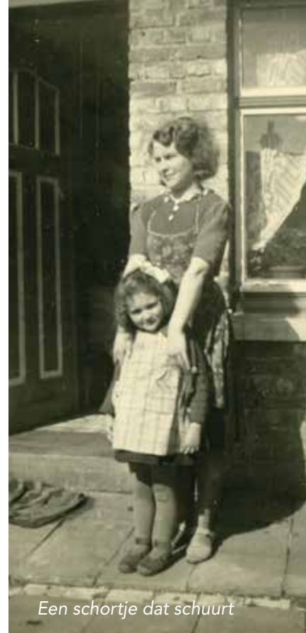
Een schortje dat schuurt

De Langestraat werd vaak gebruikt als achtergrond voor vormselfoto's. Spreekt voor zich dat het Heilig Vormsel in die tijd een belangrijke gebeurtenis was. Heel het gezin was 'upgetuttematooid' (opgemaakt) en de 'plechtige communicant' moest voor één dag in het traditionele witte kleed. Een gebruik dat op vandaag nog in enkele parochies wordt toegepast.